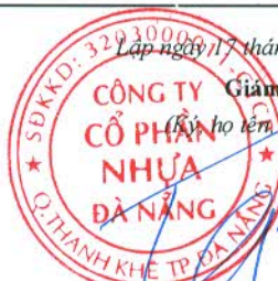
TRẦN CÔNG ĐỨC