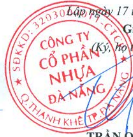
TRẦN CÔNG ĐỨC